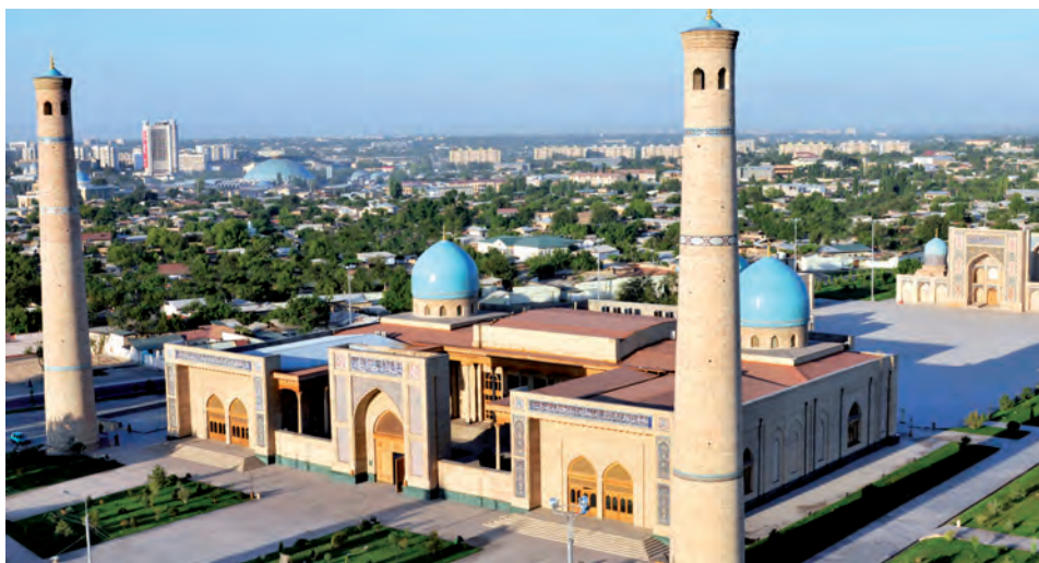
Hazrati Imom majmuasi

Agar siz Toshkentning Eski shahar qismiga qarab borsangiz, uzoq-uzoqlardan salobatli va baland qo‘sh minoraga ko‘zingiz tushadi. Ular ana shu majmua tarkibidagi Hazrati Imom jome masjidining minoralaridir.