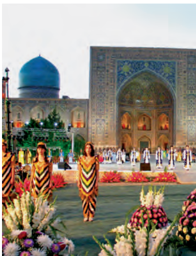
«Sharq taronalari» xalqaro musiqa festivali

Aziz o‘quvchi, siz qadimiy Samarqand haqidagi «Yer yuzining sayqali», «Rimning tengdoshi», «sharif shahar» degan ta’riflarni eshitgan bo‘lsangiz kerak. Istiqlol davrida ularning yoniga yangi ta’riflar qo‘shilmoqda. Masalan, 2014-yil, 7-iyulda Amerika Qo‘shma Statlarining jahonga mashhur «Xaffington post» internet nashri Samarqandni inson o‘z umri davomida hech bo‘lmaganda bir marta borib ko‘rishi albatta zarur bo‘lgan dunyodagi 50 ta shaharning biri sifatida e’tirof etdi va ana shunday shaharlar ro‘yxatiga kiritdi.