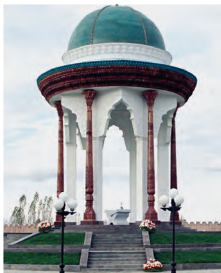
Burhoniddin Marg'inoniy xotira yodgorligi

Mamlakatimizda Termiz shahridagi Hakim Termiziy, Buxoro zaminidagi Abdulxoliq G'ijduvoni va Bahouddin Naqshband, Samarqanddagi Imom Buxoriy, Imom Moturidiy, Marg'ilondagi Burhoniddin Marg'inoniy yodgorlik majmualari kabi ko'plab buyuk qadamjolar bor. Ular yurtimizning turli shahar va qishloqlaridan, chet ellardan tashrif buyuradigan insonlar uchun qutlug' ziyoratgoh hisoblanadi. Yurtboshimiz Islom Karimov «Yuksak ma'naviyat — yengilmas kuch» kitobida bu tabarruk maskanlar haqida alohida to'xtalib, quyidagi fikrlarni ta'kidlaydi: