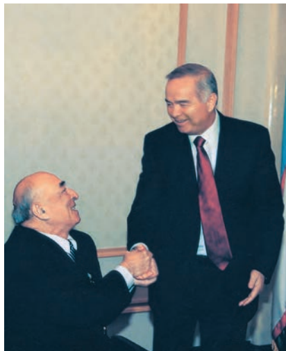
O'zbekiston Qahramonlari – Prezident Islom Karimov va adabiyotshunos olim Ozod Sharafiddinov

Vatan muhabbati ham shunday: u hammaga ko'z-ko'z qilinmaydi, u to'g'rida tantanavor e'lonlar chop etilmaydi, har muyulishda odam ko'kragiga urib, Vatanga oshiqligini pisanda qilmaydi. Madaniyatning yuksak pog'onalariga ko'tarilgan jami-