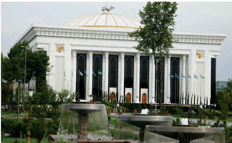
«O‘zbekiston» xalqaro anjumanlar saroyi

Prezidentimizning loyihasi va rahbarligi asosida barpo etilgan bu obida nafaqat Amir Temur xiyoboni, balki butun poytaxtimiz chiroyini yanada o‘zgartirib yubordi.