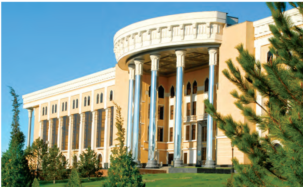
O'zbekiston davlat konservatoriyasi

Toshkent – yoshlar shahri. Bu yerda sizdek o'g'il-qizlarning bilim olishi, zamonaviy kasb-hunarlarini o'rganishi, sport, badiiy ijod bilan shug'ullanishi, madaniy dam olishi uchun barcha qulayliklar mavjud. Ko'plab maktablar, litsey va kollejlari, oliy o'quv yurtlari, stadionlar, teatr va muzeylar, istirohat bog'lari, ilm-fan, madaniyat muassasalari, yoshlar markazlari aynan ana shu maqsadga xizmat qiladi.