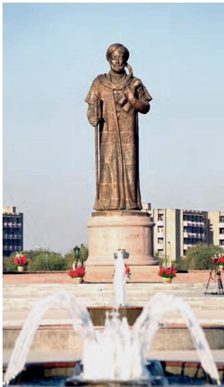
Navoiy shahridagi Alisher Navoiy haykali

Moddiy boyliklarni ezgu ishlarga xizmat qildirgan bunday saxovatli ajdodlarimizning ezgu an'alarini bugungi yurtdoshlarimiz munosib davom ettirmoqda. O'z hisobidan bog'cha yoki maktab, yo'l qurgan, bolalar uylariga, shartnoma asosida o'qiyotgan talabalarga yordam ko'rsatayotgan, mahallalar hududini obod qilishga hissa qo'shayotgan insonlar bugungi kunda yurtimizda ko'payib bormoqda. Bularning barchasi moddiy boylikni ma'naviyat yo'lida xizmat qildirishning yuksak namunasidir.