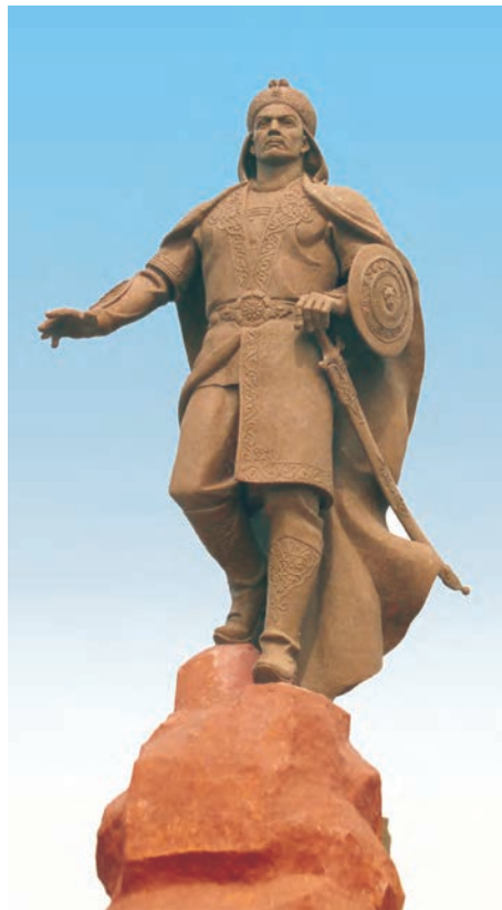
Urganchdagi Jaloliddin Manguberdi haykali

Aytishlaricha, o'sha paytda mard va shijoatli Movarounnahr farzandining ruhini sindirish uchun Chingizxon uning 7–8 yasharlik o'g'lini tutib olib qatl ettiradi. Jaloliddin dushman qo'liga asir tushmaslik uchun so'nggi soniyalarda oilasining oldiga kelib, o'z farzandlari bilan xayrlashadi. Keyin yana yovga tashlanib, ularni chekinishga majbur qiladi va qirg'oqqa borib, pishqirib oqayotgan daryoga ot soladi va undan shamoldek yelib o'tib ketadi. O'sha zahotiy oq qirg'oqqa yetib