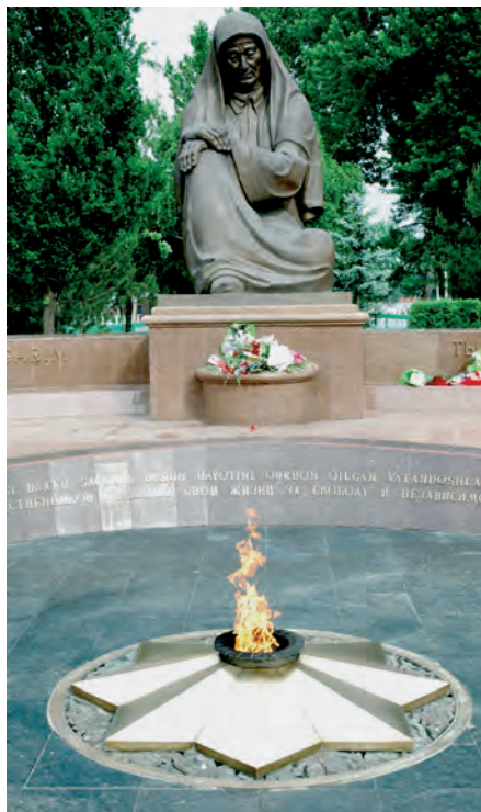
Motamsaro ona haykali

Toshkent shahridagi buyuk qadamjolar haqida gapirganda, 1999-yili barpo etilgan Xotira maydonini tilga olish o'rinni bo'ladi. Xotira maydonidagi bir-biriga qaratib qurilgan naqshinkor ustunli ayvonlardagi sahifalarga Ikkinchi jahon urushida halok bo'lgan 450 ming nafar yurtdoshimizning ismi sharifi zarhal harflar bilan yozib qo'yilgan. Bu yerdan tun-u kun ziyoratchilarning qadami arimaydi. Har bir ziyoratchi avvalo bu yerdagi Motamsaro ona haykali qoshiga borib, ushbu ulug'zotga ta'zim bajo keltiradi. Keyin ayvonlar sahni bo'ylab yurib, o'z vilo-yati uchun ajratilgan sahifalar oldida to'xtaydi. O'sha mash'um urushda halok bo'lgan jigarbandlarining ismi sharifini ana shu sahifalardan topib,