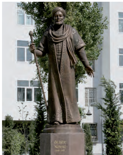
Boku shahridagi Alisher Navoiy haykali

Shuning uchun ham Prezidentimiz Islom Karimov Alisher Navoiyning buyuk dahosiga ulkan baho berib, ul zot haqida g'urur-iftixor bilan bunday so'zlarni yozgan: