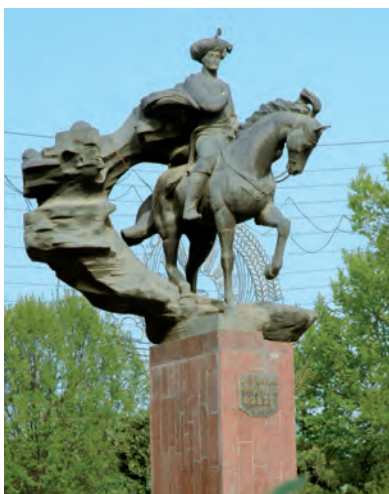
Andijon shahridagi Bobur Mirzo haykali

Ota-bobolarimizga xos ana shunday halollik, to'g'rilik, birovning haqiga xiyonat qilmaslik fazilatlari ajdodlardan avlodlarga o'tib kelmoqda. Turmush tarzimiz, milliy xarakterimizga singib ketgan bunday xususiyatlarni yurtimizda 70 yildan ziyod hukmronlik qilgan yovuz sho'ro mafkurasi ham hayotimizdan siqib chiqarolmadi. Agar siz ustoz yozuvchimiz O'lmas Umarbekovning asari asosida tayyorlangan «Qiyomat qarz» nomli spektaklni tomosha qilsangiz, unda oddiy qishloq odamining qalbida ana shunday fazilatlar e'tiqod darajasiga ko'tarilganini ko'rasiz.