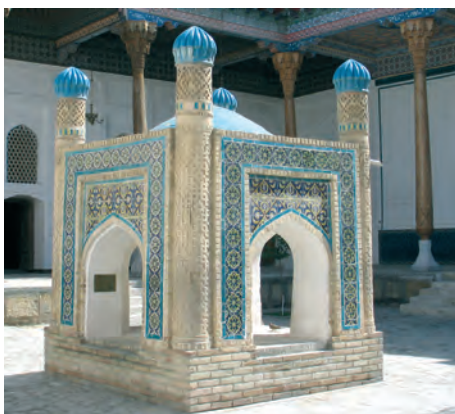
Buxoro. Bahouddin Naqshband yodgorligi

Bu holni millatimiz ma‘naviyatining yana bir muhim belgisi bo‘lmish betakror me‘moriy obidalarimiz sobiq sovet davrida qanchalik vayron qilingani misolida ham ko‘rishimiz mumkin. Yurtimizda sho‘rolar hukmronlik qilgan davrda masjid va madrasalar buzilgan, ularning omon qolganlari esa omborxonaga aylantirilgan. Aziz-avliyolarimizning qabrlari oyoqosti qilingan, ularning nomlari, o‘lmas merosi xalqimizdan yashirilgan. Hozirgi vaqtda har tomonlama obod qilinib, yurtimiz va butun dunyodan ming-