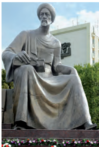
Toshkent shahridagi Ibn Sino haykali

Bir yigit qattiq betob bo‘lib qolibdi. Hech qaysi tabib uning dardiga davo topa olmabdi. Ota-onasi oxiri buyuk hakim Ibn Sinoga murojaat qilibdi. Ulug‘ alloma yigitning tomirini ushlab: «Shu yaqin-atrofdagi mahallalarning nomini aytingiz», – debdi. Qaysidir mahallaning nomi aytilganida, yigitning tomir urishi tezlashib ketibdi. Shunda Ibn Sino yana xonadon sohiblariga qarab: «Endi o‘sha mahalladagi ko‘chalarning nomini aytingiz», – debdi. Ko‘chalardan birining nomini eshitganida yigitning tomiri yana tez ura boshlabdi. Buyuk tabib bemor dardining sababini tobora aniq his etib: «Endi o‘sha ko‘chada yashaydigan qizlarning nomini aytingiz», – debdi. Qizlardan birining nomi aytilganida, yigit oh tortib yuboribdi. «O‘g‘lingizning kasali ma‘lum bo‘ldi, – debdi Ibn Sino, – uni qiynayotgan dard – muhabbat dardidir».