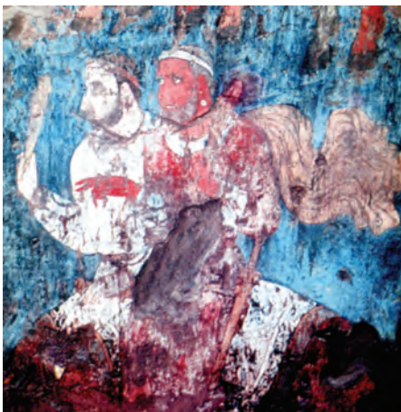
Afrosiyob tepaligidan topilgan qadimiy devoriy rasm

Qadimiy Kushonlar davlati paytida Surxon zaminida buddaviylik dini gullab-yashnagan. Buddaviylik esa Yaponiyada ajdodlarning koʻhna taʼlimoti sifatida qadrlanadi. Kato domla ana shu taʼlimotga doir moddiy yodgorliklarni topib, oʻz ajdodlarining tarixiy xotirasidagi uzilib qolgan rishtalarni tiklamoqchi. Bu — haqiqiy fidoyilikdir. Bu ilm jonkuyari xalqimizning boy tarixi, qadimiy yodgorliklari hamda madaniy merosini chuqur oʻrganish va xorijiy ellarda targʻib qilishdagi katta xizmatlari,