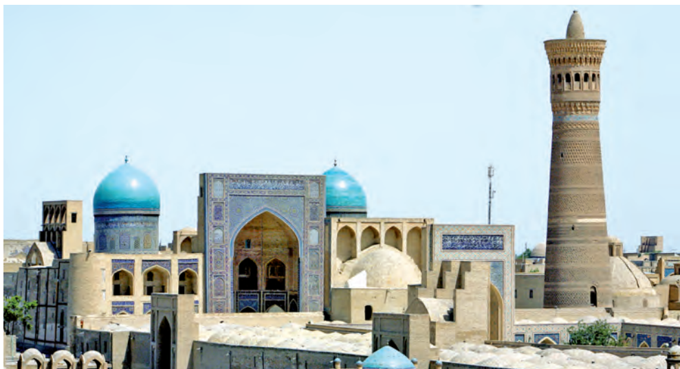
Buxoro. Minorai Kalon