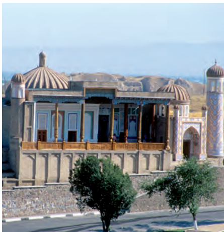
Hazrati Xizr masjidi

Ish jarayonida mutaxassislar masjidning ba'zi bir eski ustunlarini almashtirishni taklif etdilar. Yurtboshimiz bu masalaga katta qiziqish bilan qarab, ana shu ustunlarni maxsus o'rganib chiqadi. So'ngra ustunlarning naqsh va bezaklari milliy hunarmandchilik an'analarimizga mos emasligiga, ko'proq Tunis yoki Marokash davlatlarida shakllangan uslubni eslatishiga e'tibor qaratib, ularni yangidan ishlash haqida topshiriq beradi. Shu tariqa qo'qonlik ustalar masjidning ustunlarini milliy me'morlik an'analarimiz uslubida ishlab, yangidan joyiga o'rnatdilar. Bu esa ushbu qadimiy majmuaga alohida ko'rk va salobat bag'ishladi.