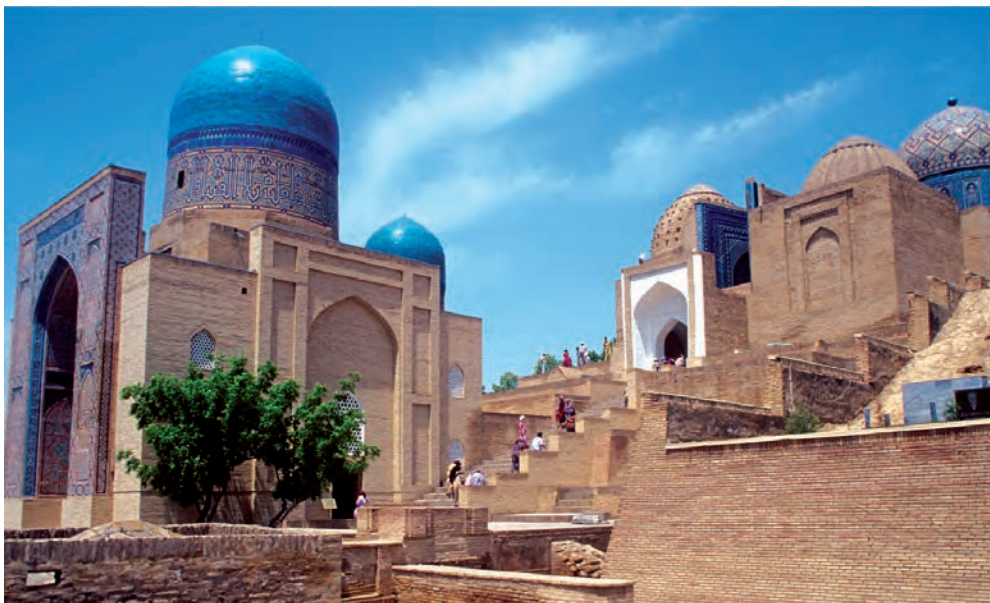
Samarqand. Shohizinda majmuasi

Bir paytlar Amir Temur bobomiz: «Kim bizning qudratimizga shubha qilsa, qurgan imoratlarimizga boqsin», – deb katta ishonch, gʻurur-iftixor bilan oʻz ishining abadiyatga daxldor ekanini taʼkidlagan edi. Sohibqiron bobomizning nabirasi, buyuk alloma va davlat arbobi Mirzo Ulugʻbek esa ilm-fan sohasidagi kashfiyotlari hech qachon yoʻq boʻlib ketmasligini nazarda tutib: «Oʻz ishimni munosib avlodlarimga qoldirdim», – deb aytgan. Mumtoz mutafakkir shoirimiz