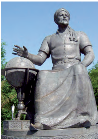
Toshkent shahridagi Mirzo Ulug'bek haykali

Mirzo Ulug'bekdan: «Siz nega siyosatdan ko'ra ilmga ko'proq qiziqqansiz?» – deb so'raganlarida, bunday deb javob bergan ekan: «Men ilmning qudratini bobomdan bildim. Bir safar bobomning tizzasida o'ltirardim. Uning huzuriga bir kishi kirdi. Bobom shoshib o'rnidan turdi. Men uning tizzasidan tushib ketdim. Bobom bunga parvo ham qilmasdan, haligi odamni kutib olishga oshiqdi. Keyin bilsam, o'sha kishi bobomga bir paytlar ilm o'rgatgan ustozim ekan. Olimlik martabasi podsholikdan ham ulug'roq ekanini o'shanda bilganman. Shunda ko'nglimda olim bo'lish havasi uyg'ongan edi».