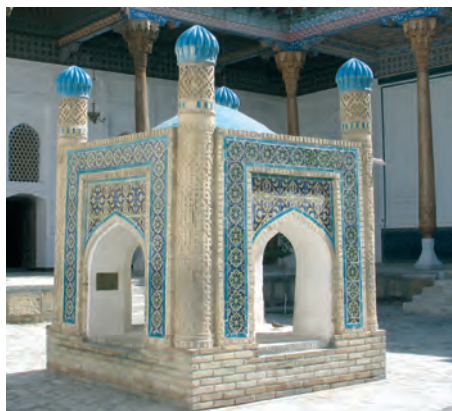
Buxara. Bahawiddin Naqshband yesteligi

Bul jag'daydi' milletimiz ma'nawiyati'ni'n' ja'ne bir a'hmiyetli belgisi bolg'an biyta'kirar arxitekturali'q yesteliklerimiz buri'ng'i' sovet da'wirinde qanshelli wayran yetilgeni mi'sali'nda da ko'riwimiz mu'mkin. Jurti'mi'zda so'vetler hu'kim su'rgen da'wirde meshit ha'm medreseler buzi'lg'an, wolar di'n' aman qalg'anlari' bolsa sklad, du'kan, ruwxiy kesellikler yemlewxanasi'na aylandi'ri'lg'an. A'ziz-a'wliyeleri'mi'zdi'n' qa'birleri ayaq asti' qi'li'ng'an, wolar di'n' ismleri, wo'lmes miyrasi' xalqi'