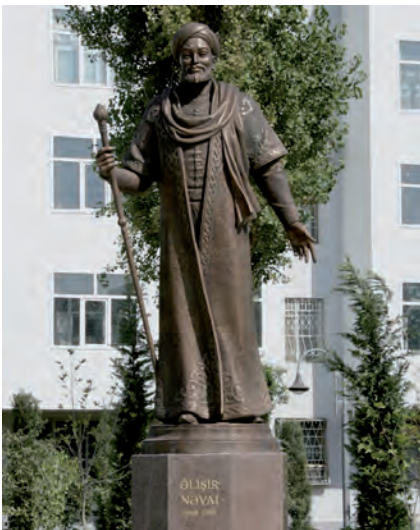
Baku qalasi’ndag’i’ A’liyser Nawayi ha’ykeli

Ja’ha’n tiltani’wshi’ ali’mlari’ du’nyadag’i’ ulli’ shayi’r ha’m jazi’wshi’lar arasi’nda yen’ ko’p so’z bayli’g’i’na iye bolg’an do’retiwshini ani’qlaw boyi’nsha izertlew ju’rgizgen. Woni’n’ na’tiyjesi boyi’nsha, ulli’ babami’z A’liysher Nawayi’ ja’ha’ndegi so’z bayli’g’i’ yen’ ko’p shayi’r si’pati’nda ta’n ali’ng’an. A’liysher Nawayi’ wo’z shi’g’armalari’nda 26 mi’n’ 35 so’z isletken yeken. Ulli’ wori’s shayi’ri’ Aleksandr Pushkin 21 mi’n’ 193, inglis shayi’ri’ Uilyam Shekspir 20 mi’n’-nan aslam so’z qollang’an yeken.