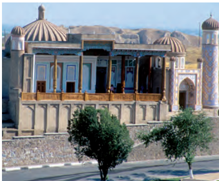
Ha'zireti Qizir meshiti

Jumi's procesinde qa'nigeler meshittin' geybir yeski u'stinlerin almasti'ri'wdi' usi'ni's yetti. Jurtbasshi'mi'z bul ma'selege u'lken qi'zi'g'i'wshi'li'q penen qarap, mine usi' u'stinlerdi arnawli' u'yrenip shi'g'adi'. Son'i'nan u'stinlerdin' nag'i'slari'menen bezewlerin milliy wo'nermentshilik da'stu'rlerine sa'ykes kelmeytug'i'ni'na, ko'birek Tunis yaki Marokko ma'mleketlerinde qa'liplesken uslubti' yesletiwine itibar qarati'p, wolardi' jan'adan islew tuwrali' tap-si'rma beredi. Usi'layi'nsha qoqanli' ustalar meshittin' u'stinlerin milliy arxitektura da'stu'rlerimiz uslub'i'nda islep, jan'adan worni'na jaylasti'radi'. Bul bolsa usi' a'yyemgi komplekske ayi'ri'qsha ko'rk ha'm saltanat bag'i'shladi'.