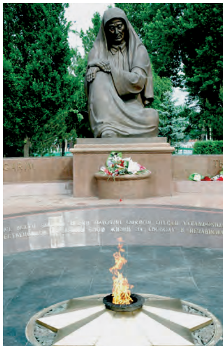
Ha'siretli ana ha'ykeli

Tashkent qalasi'ndag'i' ulli' muqa'ddes wori'nlari' tuwrali' so'z yetkende, 1999-ji'li' quri'lg'an Yeslew maydani'n tilge ali'w wori'nli' boladi'. Yeslew maydani'ndag'i' bir-birine qarati'p quri'lg'an nag'i's woyi'lg'an u'stinli a'ywanlardag'i' betlerde Yekinshi ja'ha'n uri'si'nda qurban bolg'an 450 mi'n' watanlasi'rimi'zdi'n' ismi-sha'ripleri alti'n ha'ripler menen jazi'p qoyi'lg'an. Bul jerden ku'ni-tu'ni ziyaratshilardi'n' qa'demi u'zilmeydi. Ha'r bir ziyaratshii' da'slep bul jerdegi Ha'siretli ana ha'ykeli aldi'na bari'p, usi' ulli' insang'a ta'zim yetedi. Keyin a'ywanlar maydani' boylap ju're woti'ri'p, wo'z wa'layati' ushi'n aji'ratilg'an betler aldi'nda toqtaydi'. Usi'