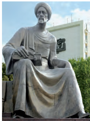
Tashkent qalasi'ndag'i' Ibn Sina ha'ykeli

Bir jigit biytop boli'p qali'pti'. Hesh bir ta'wip woni'n' da'rtine dawa taba almapti'. Ata-anasi' aqi'ri' ulli' ha'kim Ibn Sinag'a mu'ra'jat yetipti. Ulli' dani'shpan jigittin' tami'ri'n uslap: «Usi' jaqi'n a'tiraptag'i' ma'ha'llelerdin' ati'n ayti'n», — deпти. Qanday da bir ma'ha'llenin' ati' ayti'lg'anda, jigittin' tami'r uri'wi' tezlesip ketipti. Sonda Ibn Sina ja'ne u'y iyelerine qarap: «Yendi usi'