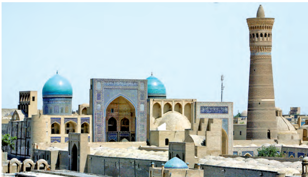
Buxara. Minarayi Ka'lan

kelindi. Yendilikte wolar xalqi'mi'zdi'n' tariyxi'y yadi'n bekkemlew, wo'zligimizdi teren' an'lawg'a xi'zmet yetpekte.