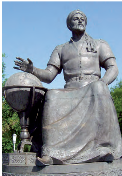
Tashkent qalasi'ndag'i' Mirza Ulug'bek ha'ykeli

Mi'rza Ulug'bekten: «Siz nege siyasattan ko're ilimge ko'birek qi'zi'g'asi'z?» – dep sorag'anda, bi'lay dep juwap bergen yeken: «Men ilimnin' qu'diretin babamnan bildim. Bir sapari' babamni'n' dizesinde woti'r yedim. Woni'n' aldi'na bir kisi kirdi. Babam asi'g'i'p worni'nan turdi'. Men woni'n' dizesinen tu'sip kettim. Babam bug'an itibar bermesten, kelgen adamdi' ku'tip ali'wg'a asi'qti'. Keyin bilsem, wol kisi bir waqi'tlari' babama ilim u'yretken ustazi' yeken. Ali'mli'q ma'rtebesi patshali'qtan da ulli'raq yekenin sol waqi'tta bilgenmen. Sonda kewlimde ali'm boli'w ha'wesi woyang'an yedi».