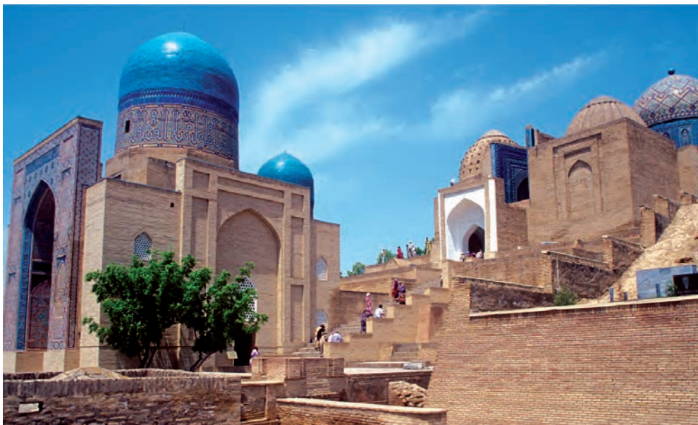
Samarqand. Shahi'zinda kompleksi

Bir waqi'tlari' Amir Temur babami'z: «Kim bizin' qu'diretimizge gu'manlansa, qurg'an imaratlari'mi'zg'a na'zer salsi'n», — dep u'lken isenim, maqtani'sh penen wo'z islerinin' ma'ngilikke tiyisli yekenin atap wo'tken yedi. Sahi'pqi'ran babami'zdi'n' aqli'g'i', ulli' dani'shpan ha'm ma'mleketlik g'ayratker Mi'rza Ulug'bek bolsa ilim tarawida ashqan jan'ali'qlari' hesh qashan jog'ali'p ketpeytug'i'ni'n na'zerde tuti'p: «Wo'z isimdi mu'na'sip a'wladlari'ma qaldi'rdi'm»,