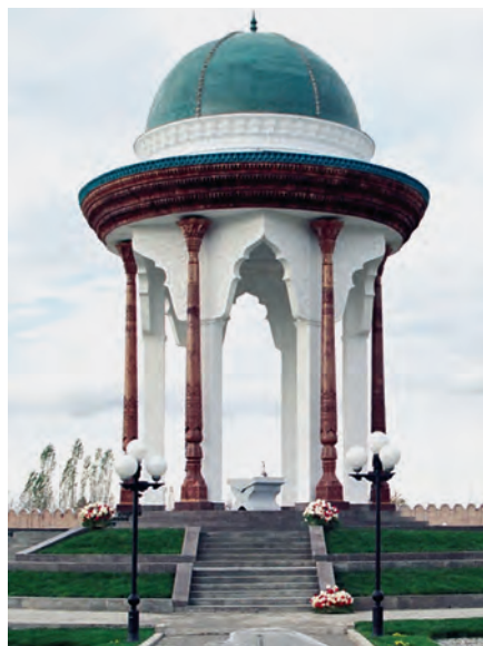
Burxaniddin Marg'inaniy yestelik kompleksi

Ma'mleketimizde Termiz qalasi'ndag'i' Ha'kim Termiziy, Buxara diyari'ndag'i' Abdulxali'q G'ijduwaniy ha'm Bahawaddin Naqshband, Samarqandtag'i' Imam Buxariy, Imam Moturidiy, Marg'ulandag'i' Burxaniddin Marg'inaniy yestelik kompleksleri si'yaqli' ko'plep ulli' muqa'ddes wori'nlar bar. Wolar yelimizdin' tu'rli qala ha'm awi'llari'nan, shet yellerden keletug'i'n insanlar ushi'n qutli' ziyarat worni' boli'p yesaplanadi'. Jurtbasshi'mi'z Islam Karimov «Joqari' ma'nawiyat – jen'ilmes ku'sh» kitabi'nda bul teberik ma'kanlar tuwrali' ayi'ri'qsha toqtap, to'mendegi pikirlerdi atap wo'tedi: