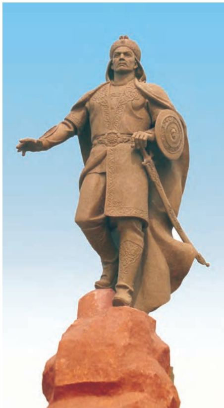
U'rgenishtegi Jalaliddin Manguberdi ha'ykeli

Ayti'wlari'na qarag'anda, sol waqi'tta ma'rt ha'm da'wju'rek Ma'werennaxr perzentinin' ruwxin' si'ndi'ri'w ushi'n Shi'n-g'i'sxan woni'n' 7-8 jasar uli'n tuti'p ali'p, wo'ltirtedi. Jalaliddin dushpan qoli'na tu'spew ushi'n son'g'i' demlerde shan'arag'i'ni'n' aldi'na kelip, wo'z perzentleri menen xoshlasadi'. Keyin ja'ne jawg'a taslani'p, wolardi' sheginiwge ma'jbu'r yetedi ha'm jag'ag'a bari'p,