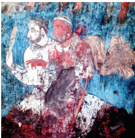
Afrasiyab to'beliginen tabi'lg'an a'yyemgi diywalg'a sali'ng'an su'wret

kekse ali'mdi' wo'z u'yin, jaqi'n-lari'n taslap, jurti'mi'zg'a keliwge, uzaq ji'llar dawami'nda i'lay, topi'raq keship, shi'jg'i'rg'an i'ssi', qaqaman suwi'q demesten, a'y-yemgi to'beshikler bawi'ri'n adi'm-lap gewlep, ilimiy izlenisler ju'r-giziwge ma'jbu'rlegen ne na'rse? Tariyx'i'y yad tuyg'i'si'.