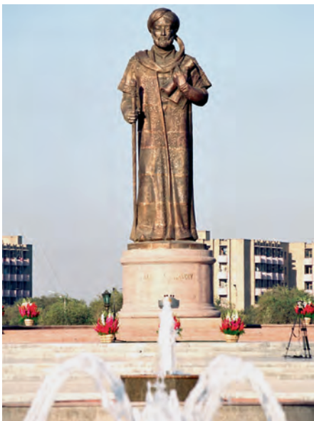
Nawayi' qalasi'ndag'i A'liysher Nawayi' ha'ykeli

ataqli' Tretyakov galereyasi' usi'-layi'nsha payda bolg'an. Bu'gingi ku'nde ha'r qanday ma'deniyatli' adam yen' a'jayi'p su'wretlew ko'r-kem wo'neri shi'g'armalari' top-lang'an bul muzeydi ko'riwdi a'rman yetedi.