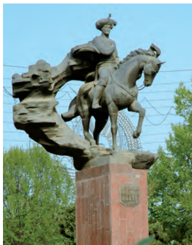
A'ndijan qalasi'ndag'i' Babur Mi'rza ha'ykeli

A'ziz woqi'wshi'! Mine usi'nday ibratli' pazi'yelletler iyesi bolg'an xali'qti'n'