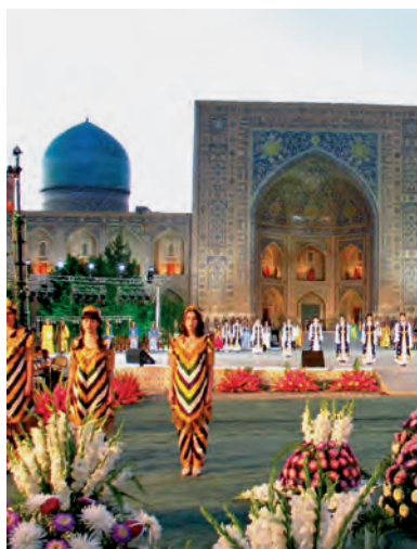
«Sharq taronalari» xali'q arali'q muzi'ka festivali'

A'ziz woqi'wshi'! Siz a'yyemgi Samarqand haqqi'ndag'i' «Jer ju'zinin' sawlati'», «Rimnin' ten'lesi», «Sharif qala» degen ta'riplerni yesitken boslan'i'z kerek. G'a'rezsizlik da'wirinde wolardi'n' qasi'na jan'a ta'ripler qosi'lmaqta. Ma'selen, 2014-ji'l 7-iyulde Amerika Qurama Shtatlari'ni'n' ja'ha'ng'e belgili «Xaf-fington post» Internet basi'li'mi' Samarqandti' insan wo'z wo'miri dawami'nda hesh bolmag'anda bir ma'rte bari'p ko'riwi a'lbette za'ru'r bolg'an du'nyadag'i' 50 qalani'n' biri si'pati'nda ta'n aldi' ha'm mine usi'nday qalalar dizimine kirgizdi.