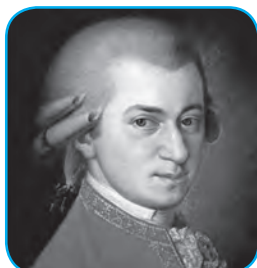
Вольфганг Амадей Моцарт