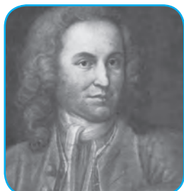
Иоганн Себастьян Бах