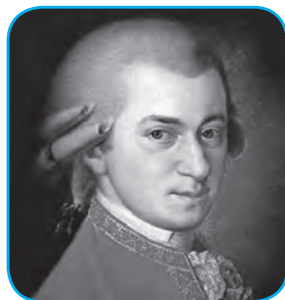
Volfgang Amadey Motsart