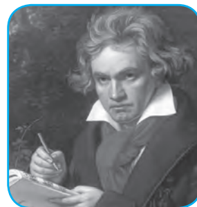
Lyudvig van Betxoven

Qadimda jangchilar jang oldidan nog'ora, karnay-surnaylar chalib ruhlantirilgan. Musiqa ohangi ularning qalbidida ona-Vatanga bo'lgan muhabbatni jo'sh urdirgan.