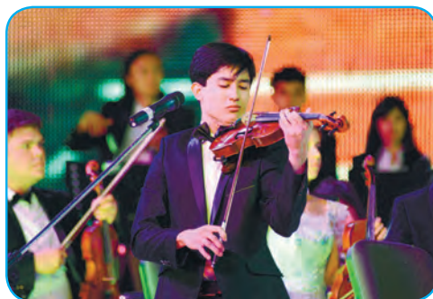
Xalqaro musiqiy tanlovlar g'oliblari

Musiq va qo'shiqqa muhabbat inson qalbiga ona allasi bilan singadi. Go'dak ona allasining ta'sirida orom oladi, tinchlanadi.