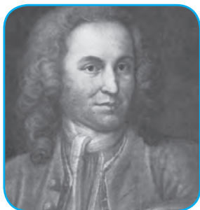
Iogann Sebastyan Bax