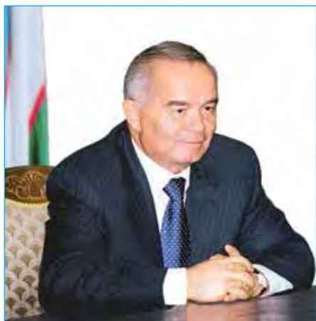
Ислам Каримов – Первый Президент Узбекистана

С ПРАЗДНИКОМ, ДНЁМ НЕЗАВИСИМОСТИ РЕСПУБЛИКИ УЗБЕКИСТАН!