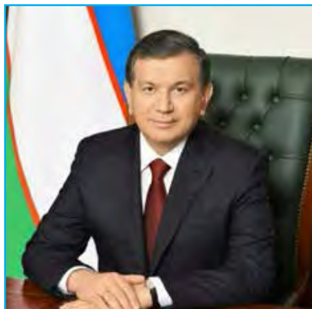
Шавкат Мирзиёев – Президент Узбекистана