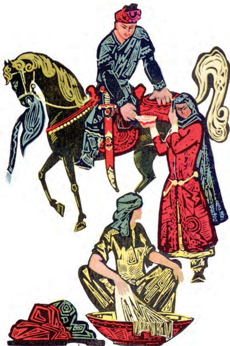
«Go'ro'g'lining tug'ilishi» dostoniga ishlangan rasm