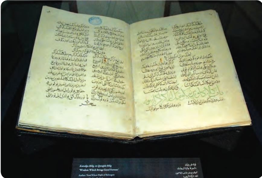
«Qutadg'u bilig»ning Qohira muzeyida saqlanayotgan qo'lyozma nusxasi