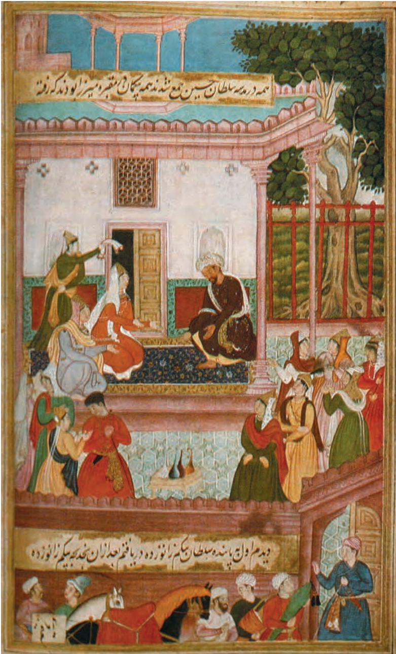
Bobur Hirotda Sulton Husayn xonadonida. «Boburnoma»ga ishlangan miniatyura