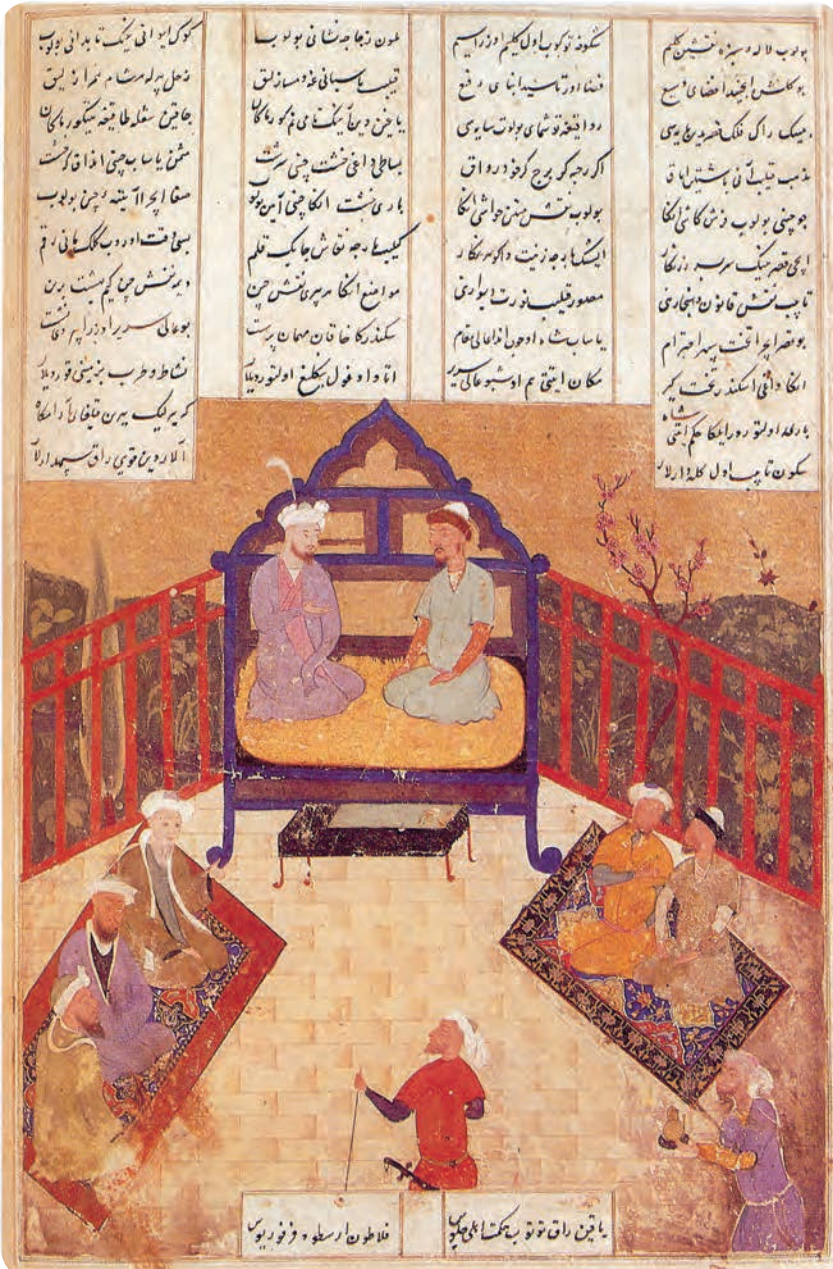
Iskandarning donishmandlar bilan suhbat. «Saddi Iskandariy» dostoniga ishlangan miniatyura