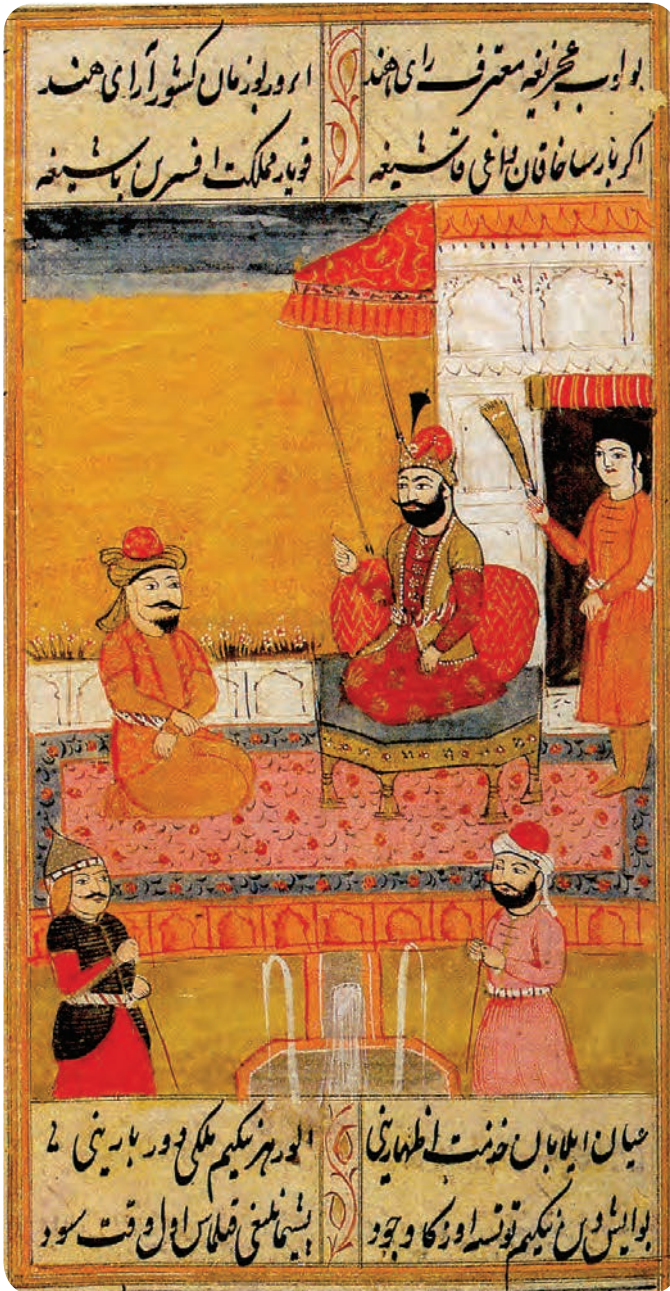
Hind hokimi Iskandar huzurida. «Saddi Iskandariy» dostoniga ishlangan miniatyura