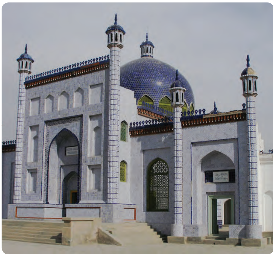
Yusuf Xos Hojib maqbarasi. Koshgʻar shahri

Umumiy hajmi olti ming olti yuz baytdan ortiq boʻlgan dostonning bir yarim yilda yozilishi adibning juda katta tajribasi va ulkan mahoratidan dalolatdir. Asar Qashqarda tugatiladi va mamlakat eligi — hukmdori Tavgʻach ulugʻ Bugʻroxonga tortiq qilinadi. Buning evaziga esa u xos hojiblik lavozimi bilan taqdirlanadi. Bular asardagi nasriy muqaddimada oʻz aksini topgan.