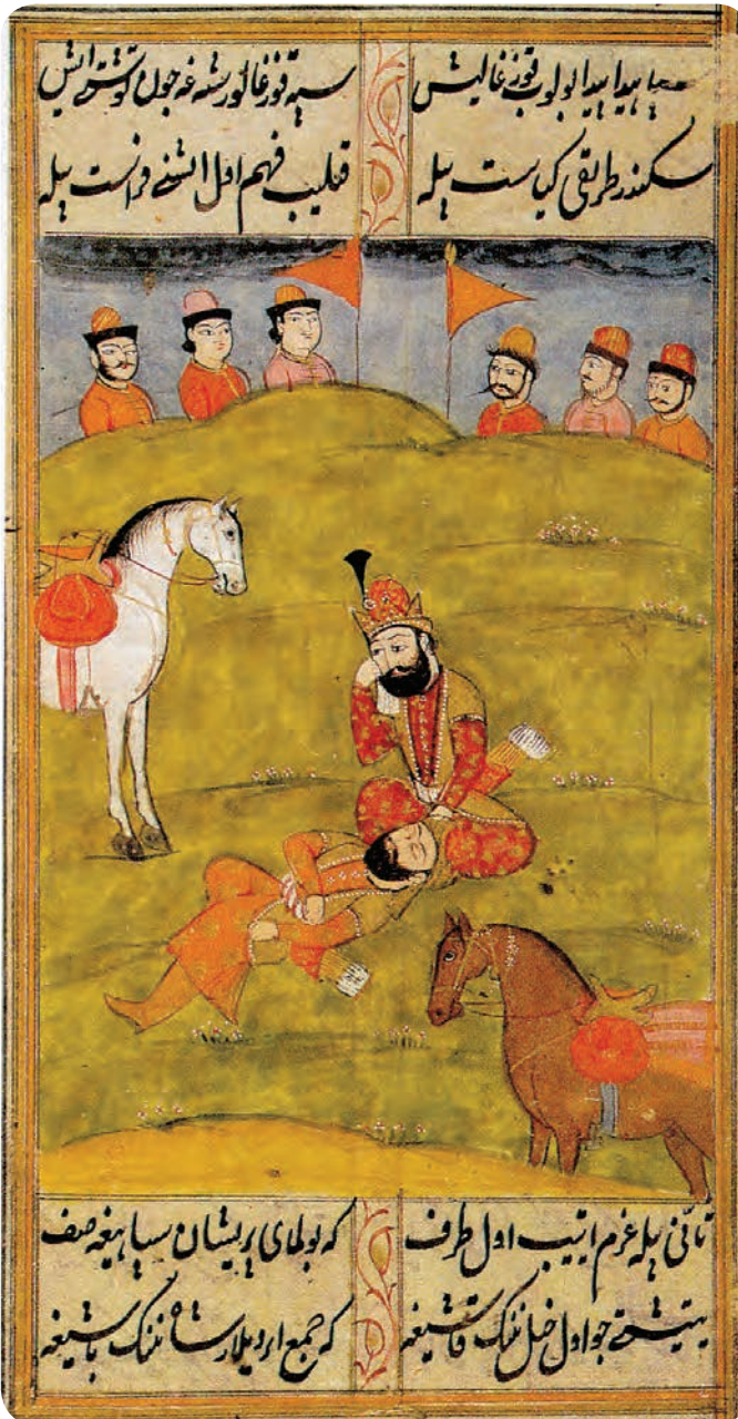
Iskandar va jon berayotgan Doro. «Saddi Iskandariy» dostoniga ishlangan miniatyura