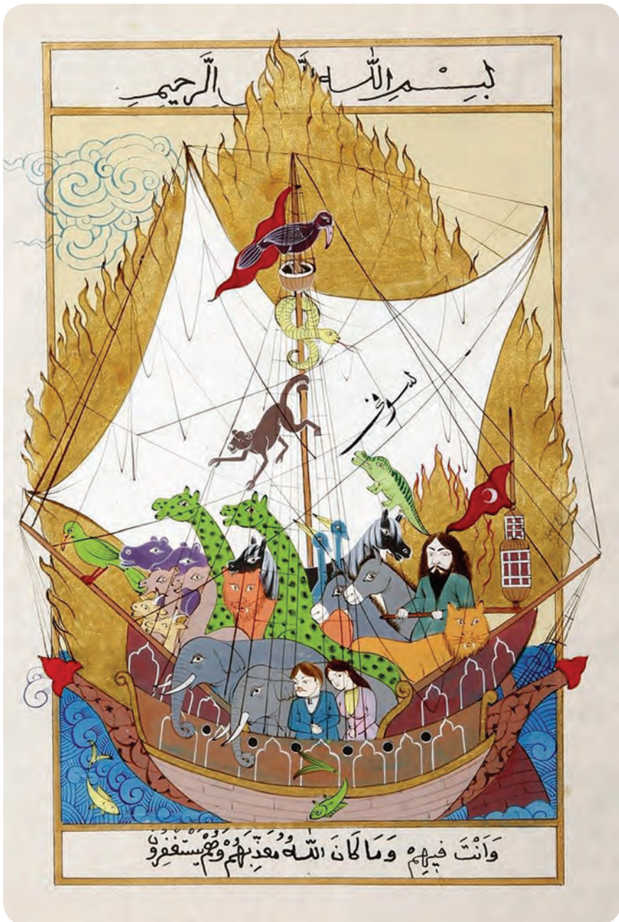
«Nuh to'foni qissasi»ga ishlangan miniatyura