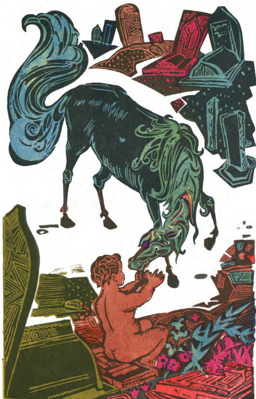
«Go'ro'g'lining tug'ilishi» dostoniga ishlangan rasm