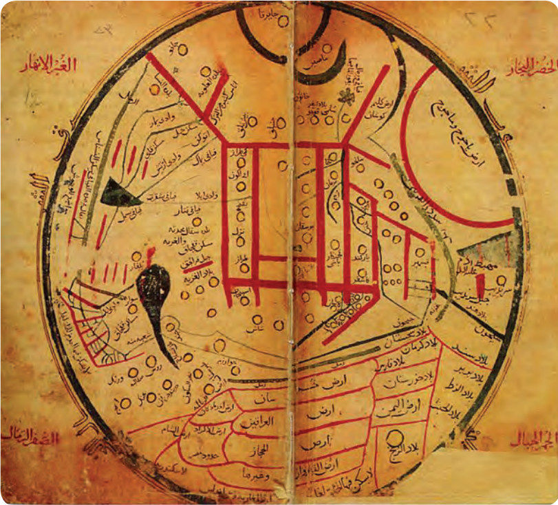
«Devonu lug'ot at-turk» asaridagi xarita

«Devon»ga kirgan adabiy shakllarning asosiy qismini to'rtliklar tashkil qiladi. Adabiyotda to'rtlik shakliga tayanadigan she'riy janrlar ( to'rtlik, ruboiy, tuyuq, murabba' )ning rivojlangani ma'lum. Mahmud Koshg'ariy ularni, asosan, qo'shug' yoki she'r deb nomlagan.