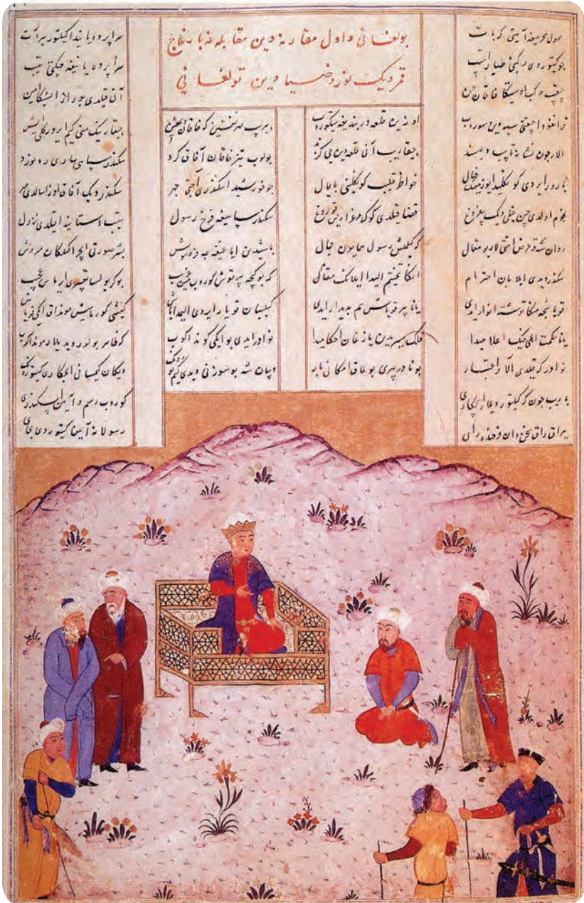
Iskandar Chin mulkida. «Saddi Iskandariy» dostoniga ishlangan miniatyura