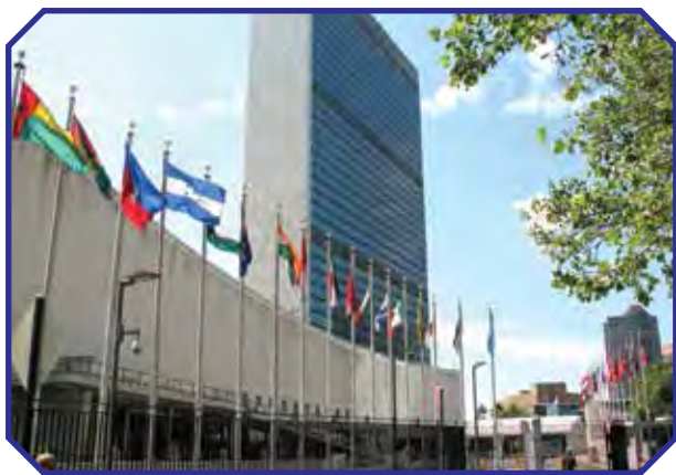
БУУ штаб квартирасы. Нью Йорк

1989-жылда Өзбекстанда Баландар укуктары жөнүндөгү Конвенцияга кол коюлду, аны иш жүзүнө ашыруу максатында «Соғлом авлод учун» фонду түзүлдү.