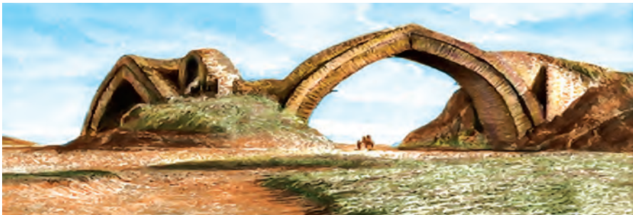
Кўпури болои дарёи Зарафшон—таксимоти об