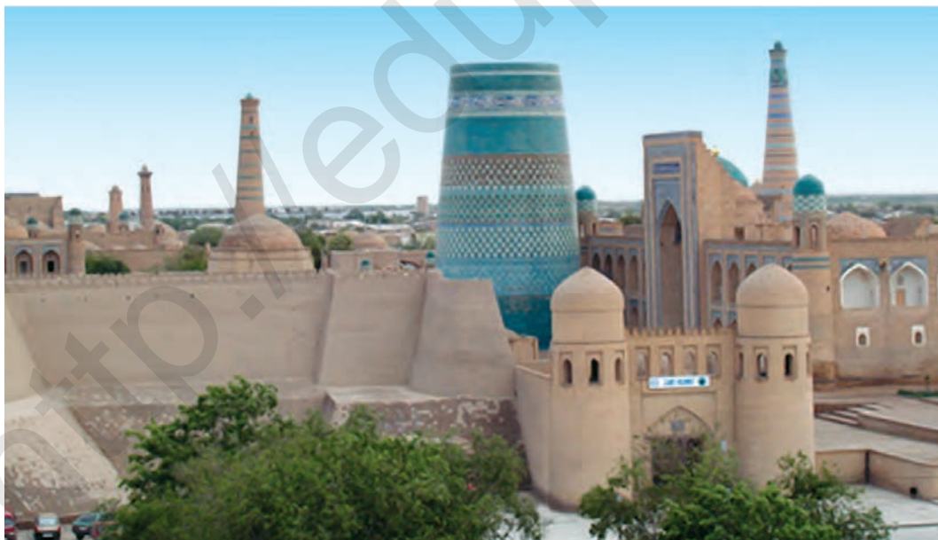
Хива. Ичан қалъа

Ичан қалъа Ичан қалъа ёдгории ноёб ва бузургтарини меъмории Осиёи Миёна, ки аз аҷдодон мондааст, ба шумор меравад. Ичан қалъа қисми дохилии (Шаҳристони) шаҳри Хива аст. Ичан қалъа аз Дишан қалъа бо девор ҷудо карда шудааст. Ба он ба воситаи чор дарвоза – Боғча, Полвон, Тош ва Ота мебаромаданд. Обидаҳои аҷоибӣ меъмории диёри Хоразм – мадраса, масҷид, қасри хон, биноҳои маъмурӣ, майдони асосӣ ва манораҳо дар дохили Ичан қалъа ҷойгиранд. Дар замони Муҳаммад Раҳимхон, Оллоқулихон ва Муҳаммад Аминхон дар Ичан қалъа қорҳои бузургмиқёси бунёдгарӣ ба амал бароварда шудааст. Қасрҳои мўхташам, мадраса ва мақбараҳо барпо карда шуданд. Қасри арки Кўҳна қад қашид. Муҳаммад Аминхон дар шафати Кўҳна арки қисми ғарбии Ичан қалъа манораи машҳури Қалтаминорро созонд. Ҳангоми сохтани Ичанқалъа меъмори Хива