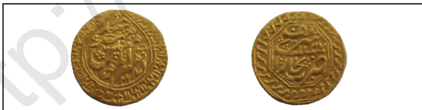
Тангаҳои тиллоии соли 1809 (Хива)

Бино ба ислоҳоти соҳаи андоз доиман чамъ овардани он таъмин шуд. Акнун ҳокимони маҳаллӣ андози заминро чамъ намекарданд, онро амалдороне, ки хон таъин мекард, меғундоштанд. Акнун қисми зиёди андози замин дар шакли пул чамъ карда, ҳамаи он ба хазинаи умумидавлатӣ супурда мешуд. Инчунин ташкили хизмати гумрук ва сикка задани тангаҳои тилло даромади хазинаи давлатро афзоиш дод. Муҳаммад Раҳимхони I дар мамлакат нўшиданро манъ кард.