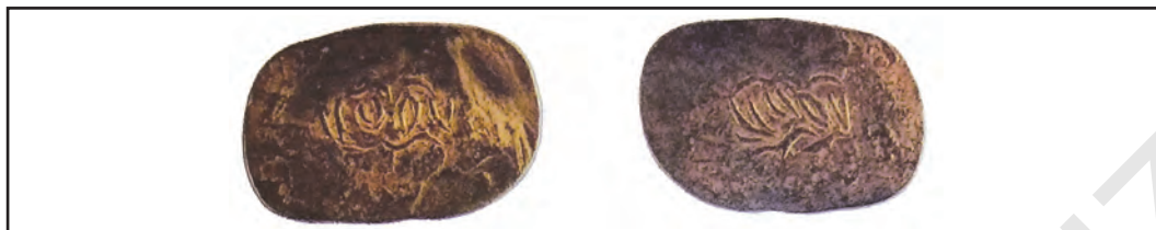
Тангаи мисин. Асри XVI

ба боло бурдани имконияти додани андоз барои деҳқонон, ба афзоиши мулки давлати хизмат кард.