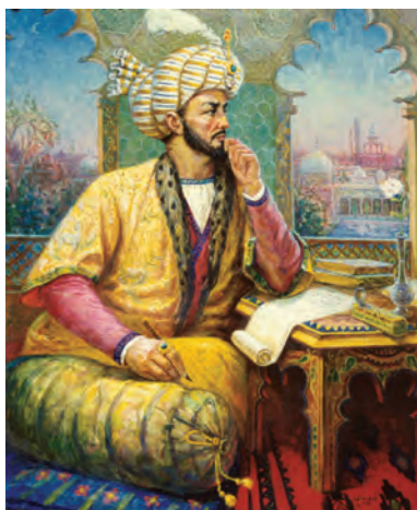
Захириддин Мухаммад Бобур

Арбобони бонуфузи давлатии Мовароуннахр тахти раҳнамоии шайхулислом Абулмакорим Бобур Мирзоро ба ишғол намудани тахти Самарқанд даъват карданд. Бобур Мирзо ба манфиати сулола содиқ буд, ӯ тирамоҳи соли 1500 ба Самарқанд лашкар кашид ва бори дуюм ба тахт нишаст.