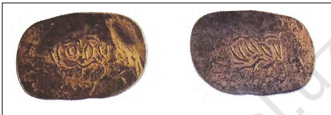
Мыс теңге. XVI ғасыр

кетуіне шек қойылды. Ол алтын ақша соғуын да жолға қойды және оның құрамына құны төмен болған басқа қоспалар араласпағанын қатты бақылап отырды. Бұл ақшалар хандықтың бүкіл аумағында айналымға кірді. Бұл реформа сонымен қатар, биліктің орталықтандырылуына, қазынаға үлкен табыс түсуіне алып келді. Сондай-ақ, ішкі және сыртқы сауда одан әрі дамуы үшін қолайлы жағдай жасады.