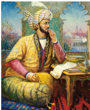
Захириддин Мухаммад Бабыр