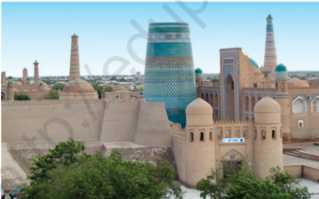
Хиуа. Ичан бекінісі

Ичан бекінісі Ичан бекінісі бабаларымыздан қалған Орта Азиядағы ірі және құнды сәулеткерлік ескерткіш болып табылады. Ичан бекінісі Хиуа қаласының ішкі бекінісі (Шахристан) бөлігі. Ичан бекінісі Дишан бекінісінен қабырғамен бөлініп тұрады. Оған Бақша, Палван, Тас және Ата деп аталған төрт қақпа арқылы кірілген. Хорезм өлкесі сәулеткерлігінің ғажайып зияратханалары – медресе, мешіт, хан сарайы, әкімшілік ғимараттар, басты алаң және мұнаралар Ичан бекінісінде жайғасқан. Мұхаммед Рақымхан, Аллақұлыхан және Мұхаммед Аминхан үстемдіктері дәуірінде Ичан бекінісінде кең көлемді жасампаздық жұмыстары жүзеге асырылды. Сәулетті сарай, медресе мен кесенелер орнатылды. Көне арктегі сарай құрылысы аяқталды. Мұхаммед Аминхан Ичан бекінісінің батыс бөлігіндегі Көне арк қасына Келте Мұнара атымен әйгілі болған мұнараны құрғызды. Ичан бекінісін құрғанда Хиуа сәулеткерлері Орта Азияда ежелден жалғасып келе