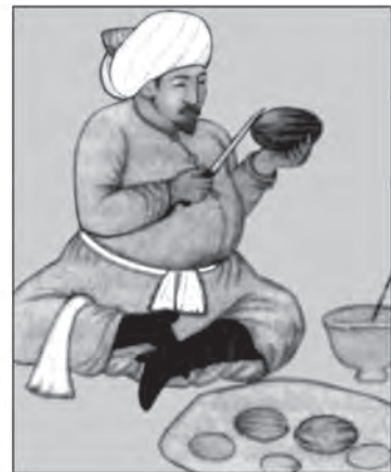
Абдуллахан II (миниатюра, 1572)

Мұхаммед Ислам және оның ұрпақтары өздерінің келіп шығуын әкесі жағынан Мұхаммед пайғамбар ұрпақтарына, ал анасы жағынан Шыңғысхан мен Жошыға байланыстыратын еді. XVI ғасырдың екінші жартысында Мұхаммед Ислам, кейін келе